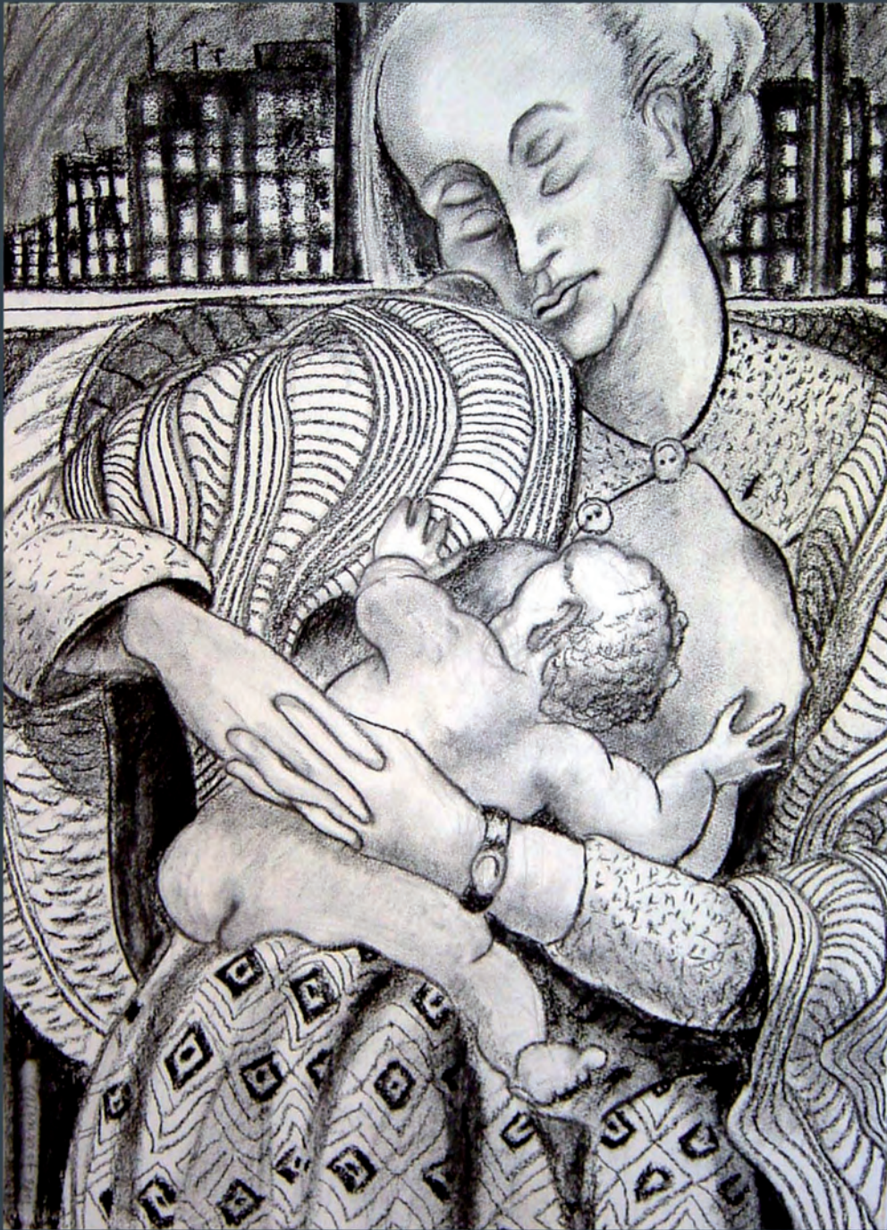
Maternité 76 X 56